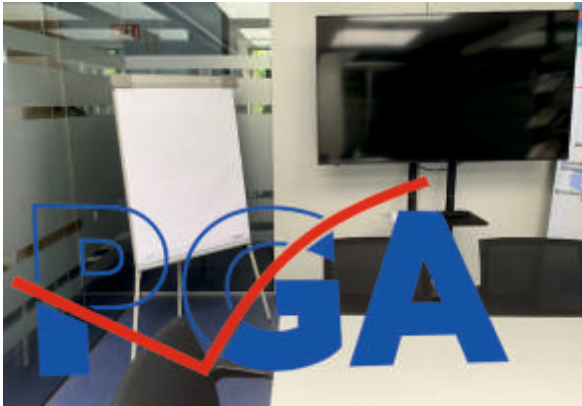
Empfangsbereich der PGA